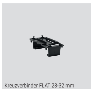
Kreuzverbinder FLAT 23-32 mm

Eine verwindungssteife und regelkonforme Unterkonstruktion schnell und präzise erstellen: die unterschiedlichen Kreuzverbinder machen es für die Aufbauhöhe ab 23 mm möglich. Durch einfaches Aufklicken fixieren sie die Kreuzverbinderprofile bzw. die Konterlatte an den tragenden CLIP-Schienen und erleichtert die Arbeitsschritte beim Montieren und Ausrichten der Unterkonstruktion um mehr als 30 % gegenüber einer herkömmlichen Konterlatten-Montage.