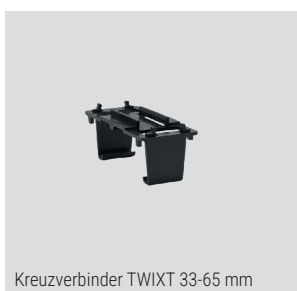
Kreuzverbinder TWIXT 33-65 mm

Material: Hartkunststoff, Polypropylen - Herstellung aus recyceltem Material (Regranulat)